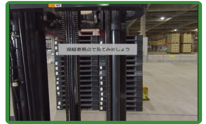
シーン：バック走行（操縦者視点）