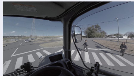
シーン：右折時の目視による視界