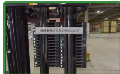
シーン：バック走行（操縦者視点）